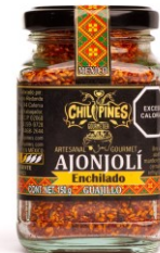
Tarro de vidrio

Presentación: Especiero 80 g Caducidad: 1 años T. Almacén: 21°C Ingredientes: Ajonjolí, chile guajillo, sal, aceite vegetal comestible, ácido cítrico, limón deshidratado, antioxidantes y silicato de calcio como anti humectante.