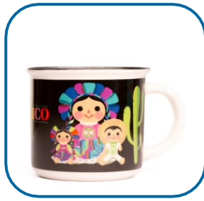
Taza mediana 10 oz

Presentación: 3 oz Tamaño: 5x6 cm Material: Porcelana Diferentes modelos