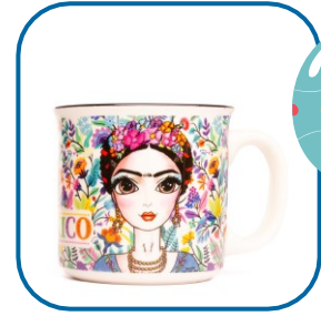
Taza Grande 13 oz

Presentación: 10 oz Tamaño: 9 x 9.5 cm Material: Porcelana Diferentes modelos