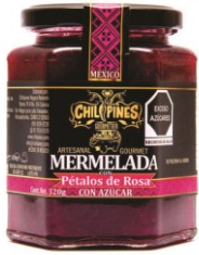
Pétalos de Rosa

Presentación: Frasco 320g Caducidad: 2 años T. Almacén: 21°C Ingredientes: Agua, azúcar, pétalos de rosa, ácido pectina, esencia de rosa, ácido sórbico como conservador.