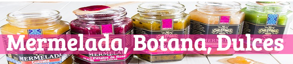
Mermelada, Botana, Dulces