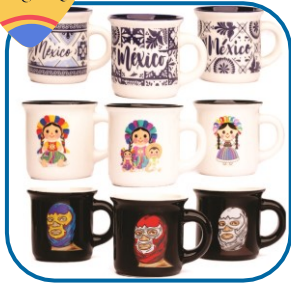
Mezcaleros 3 pack

Presentación: 3 oz Tamaño: 5x6 cm Material: Porcelana Diferentes modelos