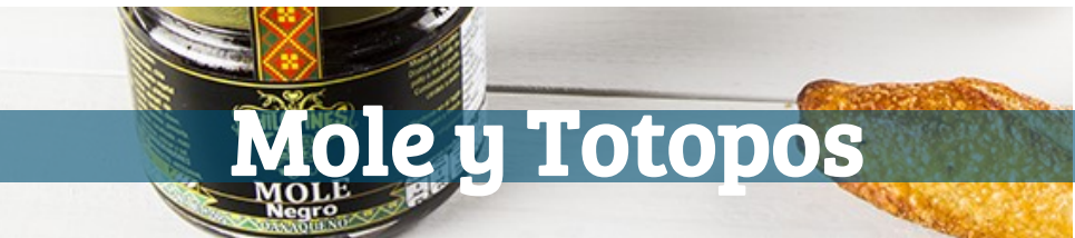
Mole y Totopos